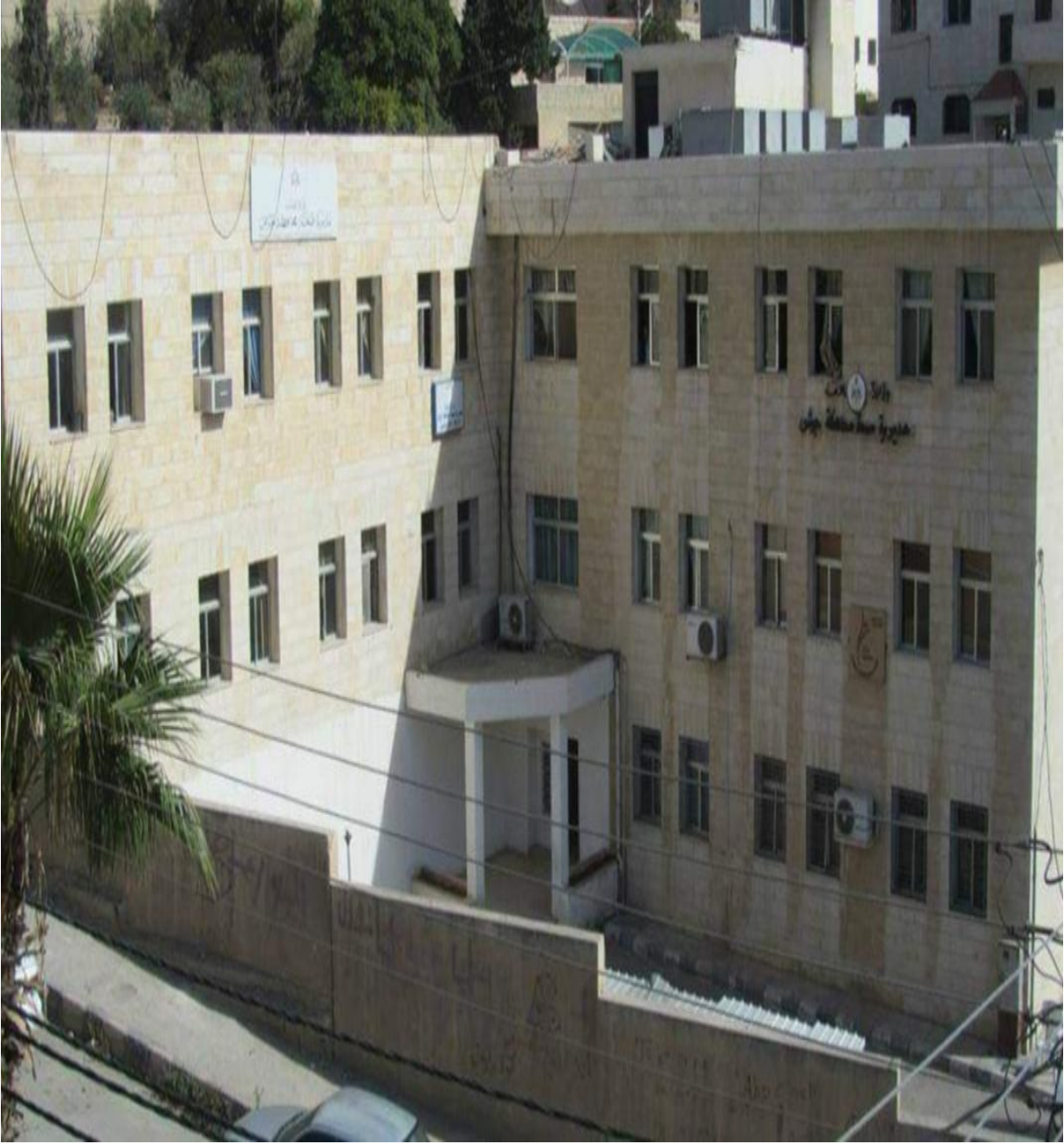
مديرية صحة محافظة جرش