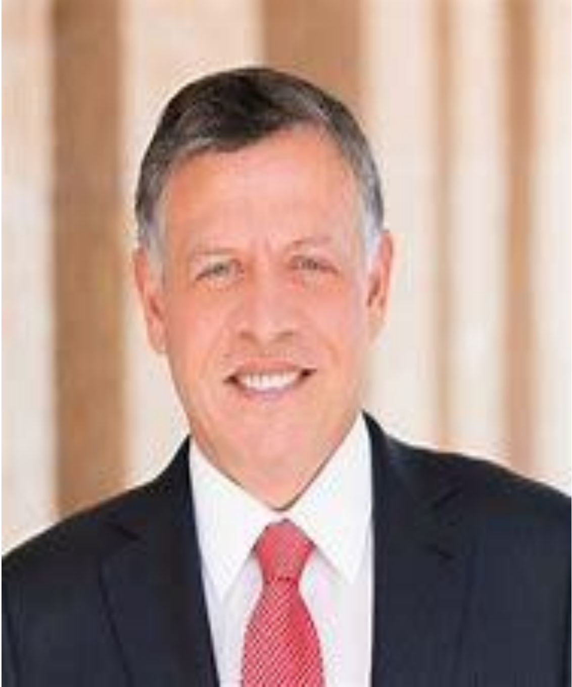
جلالة الملك عبد الله الثاني بن الحسين المعظم